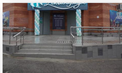
Место № 2

Выполните задания и ответьте на вопросы: