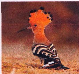
Удод (лесной петушок)

Песня удода — «уп-уп-уп», повторяемое бесконечно, — напоминает постукивание по днищу большой деревянной бочки .